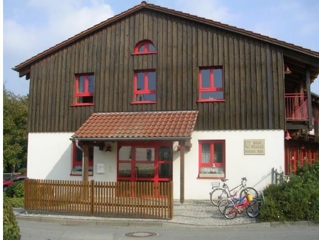
Ev. Kindergarten, Studierweg 2, 97318 Sickershausen